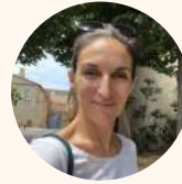
Caroline Mahoux Communication