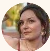
Eva Ruiz Animations, Photothèque